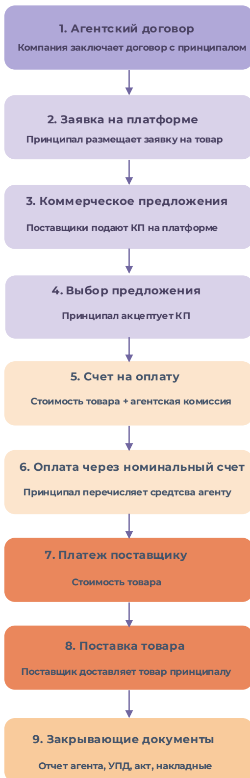
Схема типовой сделки